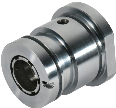
Rundteile von NONNENMANN