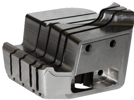
Zeichnungsteile als verlängerte Werkbank