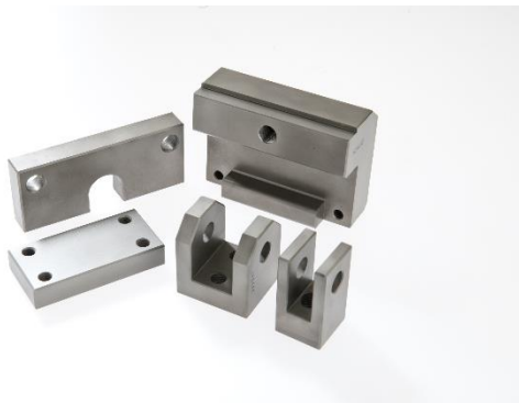
Zeichnungsteile für den Maschinenbau nach Kundenvorgabe