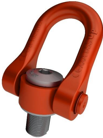
Doppelwirbelringschrauben bis M100