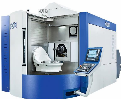
5-Achs-Bearbeitungszentrum GROB „G550“ zur Formplattenbearbeitung