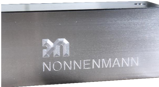
Individuelle Formaufbauten von NONNENMANN