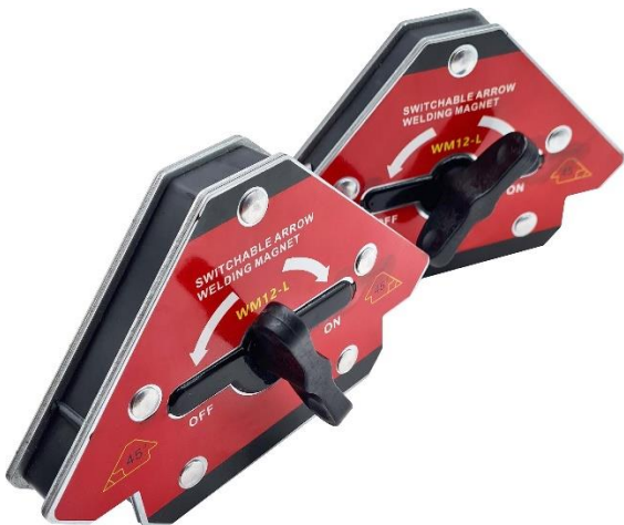
Schaltbarer Magnet, WA0050

www.nonnenmann.net/unternehmen/presseinformationen/medien/