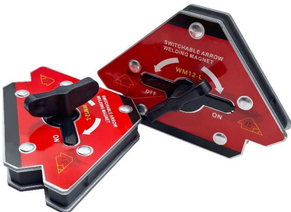
Winkelmagnet für verschiedene Haltepositionen